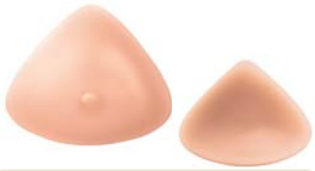
Essencial 3S Ref. 363 | Tam: 0-12

Concebida para responder às necessidades essenciais das mulheres operadas à mama.