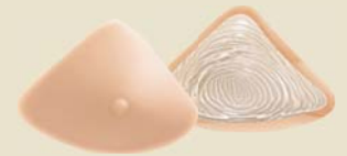
Natura Light 2A Ref. 392 | Tam: 0-14