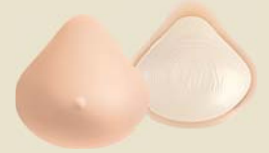
Natura 1S Ref. 396 | Tam: 1-14

Tecnologia Comfort+ de regulação de temperatura. Reduz a transpiração para uma maior comodidade comfort+.