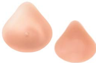
Essencial 1S Ref. 630 | Tam: 1-12