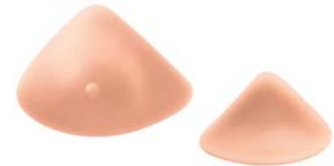
Essencial 2A Ref. 353 | Tam: 0-12