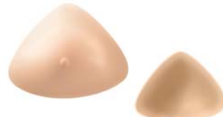
Essencial Light 2S Ref. 442 | Tam: 1-17