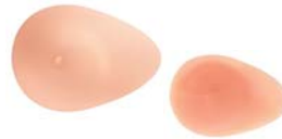
Essencial 2E Ref. 474 | Tam: 0-12