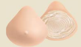
Natura Light 1S Ref. 664 | Tam: 0-14