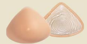
Natura Light 3S Ref. 391 | Tam: 0-12